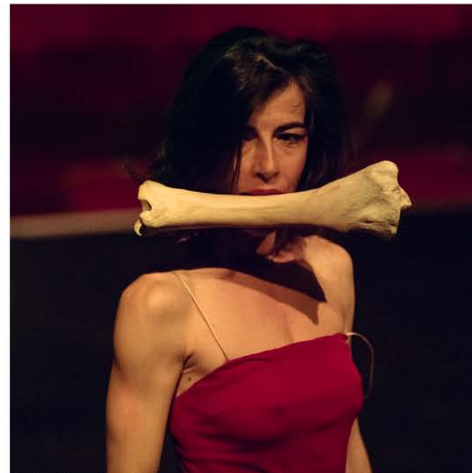
Staying Alive - Matarile Teatro

Premio Compostela de Teatro a la Labor Teatral 1993 Premio Xiria (Cangas) a la Labor Teatral Premio Zapatilla de ARTEZ 2005 al equipo Matarile, y al Festival Internacional de Danza En Pé de Pedra Premio de la Crítica de Galicia 2006 al Festival Internacional de Danza En Pé de Pedra Premio Abrente MIT de Ribadabia 2010 a la Labor Teatral de Matarile, el Teatro Galán y el Festival Inter. En Pé de Pedra de Compostela Nominación a los premios de la Feria Internacional de Teatro y Danza de Huesca a la Mejor Programación de Danza en España 2005