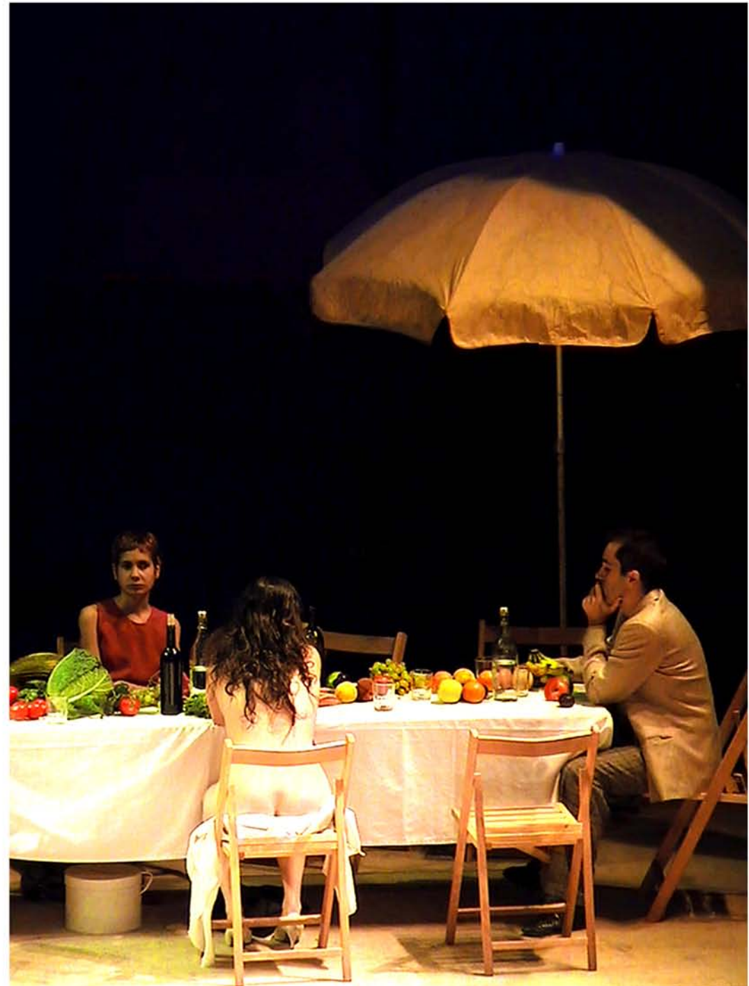
Historia Natural en el Teatro de la Abadía de Madrid

Documenta en 70 páginas la última actuación de Matarile en 2010 en su despedida temporal.