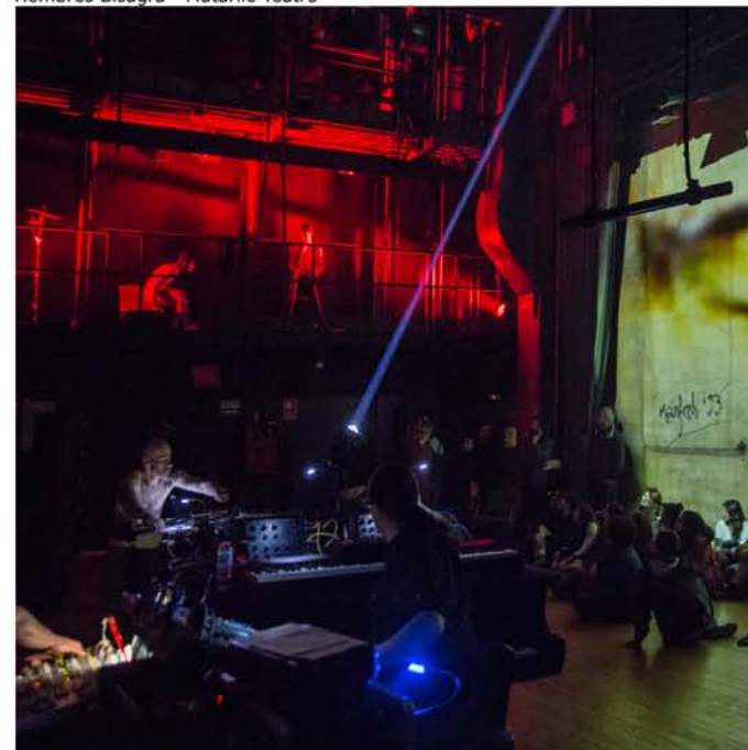
Hombres Bisagra - Matarile Teatro